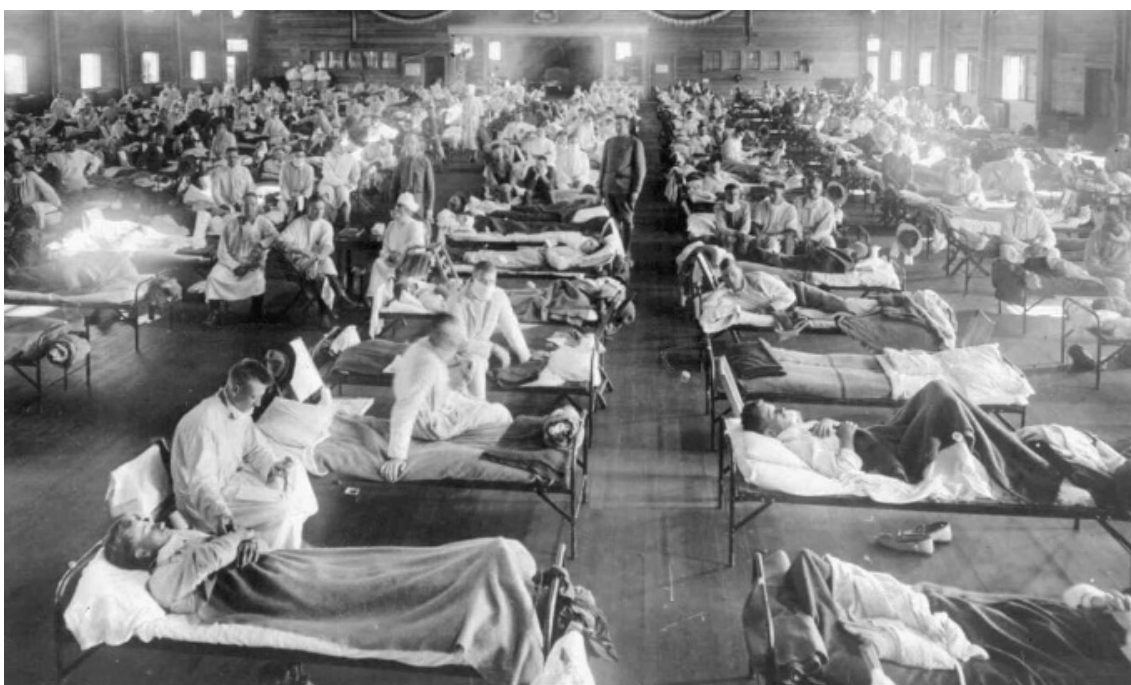
تصویر شماره‌ی ۱- یکی از بیمارستان‌های بیماران آنفلوآنزای اسپانیایی در آمریکا، در سال ۱۹۱۸م. (۳)

مناطق از آسیا، قبل از گسترش سریع در سراسر جهان، مشاهده شد. در آن زمان، هیچ دارو و واکسن مؤثری برای درمان چنین آنفلوآنزای قاتلی وجود نداشت؛ بنابراین، به شهروندان دستور داده شد که از ماسک استفاده کنند. مدارس، تئاترها و مشاغل نیز، تعطیل و اجساد، قبل از پایان جولان مرگ‌بار جهانی ویروس، جمع‌آوری شدند (۲و۱) (نک: تصویر شماره‌ی یک).