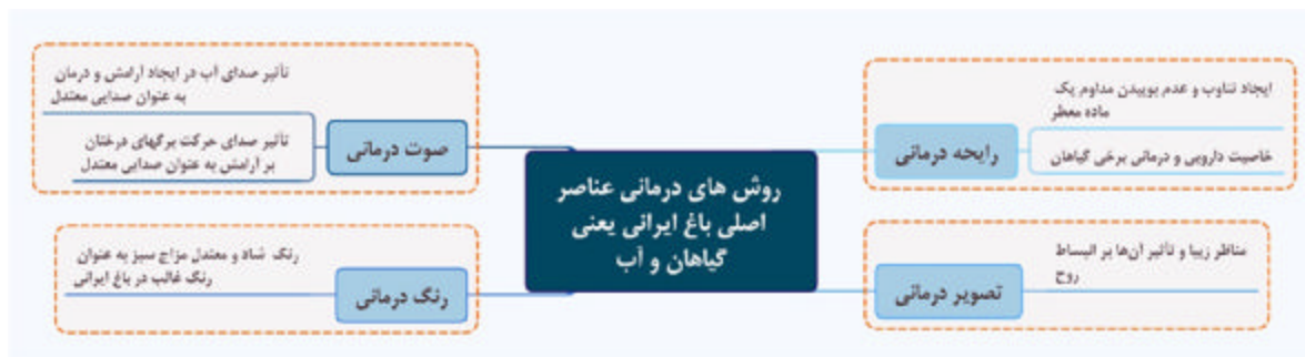
شکل شماره‌ی ۱- تأثیر عناصر نشا‌آور در باغ ایرانی بر سلامتی و درمان، بر اساس طب سنتی ایران

بهرتر بین محیط و انسان باشد؛ زیرا سبب آرامش و بهبود وضعیت جسمی و روحی و روانی می‌شود؛ در نتیجه می‌توان گفت، باغ ایرانی به دلیل کاربرد مؤثر در حفظ سلامتی و شفای بیماری‌های جسمی و خصوصاً روحی و روانی، فقط کارکرد