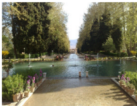
تصویر شماره ۱- باغ شاهزاده‌ی ماهان، مأخذ: نگارنده