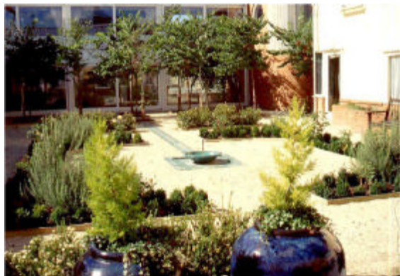
تصویر شماره ۴- استفاده از الگوی باغ ایرانی در طرح محیطی درمانی مؤسسه‌ی مراقبت از سالمندان در انگلستان