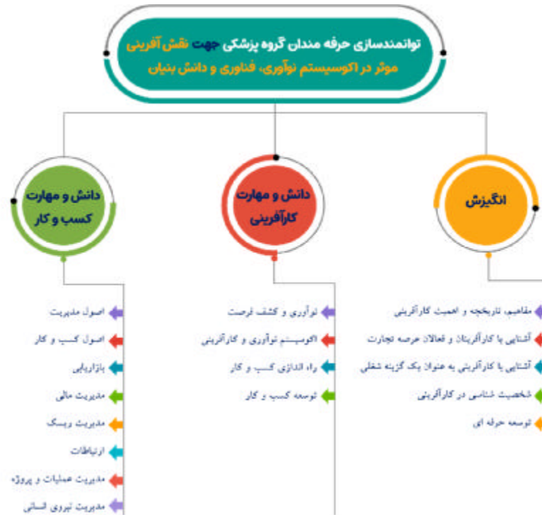
شکل شماره ۲- سرفصل‌های توانمندسازی حرفه‌مندان گروه پزشکی