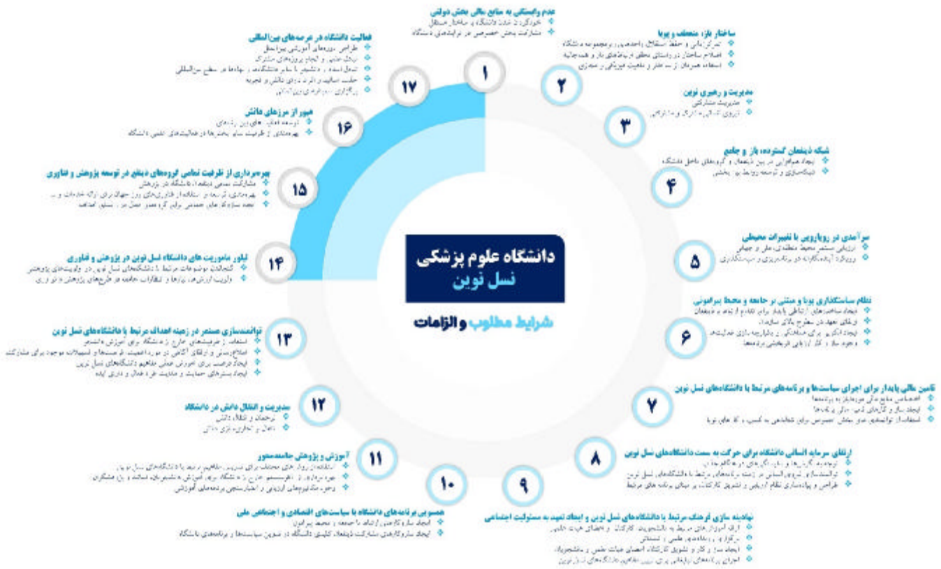
شکل شماره ۲- شرایط مطلوب و الزامات دانشگاه‌های علوم پزشکی نسل نوین

برخوردار باشد (40). بدین منظور تعهد مدیران ارشد سازمان (41)، ایجاد مسیرهای ارتباطی پایدار با ذینفعان (42)، وحدت رویه و نظام همکاری درون بخشی و ارزیابی مستمر سیاست‌های دانشگاه از الزامات دستیابی به این هدف می‌باشد. لذا برای اجرای موفق برنامه‌های مرتبط با دانشگاه‌های نسل نوین، ضروری است تا ساختار یکپارچه‌ای، متشکل از تمامی بخش‌های مرتبط با اجرای این برنامه‌ها، ایجاد و با تدوین رویه‌ای یکسان برای اجرای برنامه‌ها و پیگیری آن در داخل و خارج از دانشگاه، بسترهای اجرای موفق برنامه‌ها فراهم گردد (43). همچنین ضروری است تا ساز و کار ارزیابی اثربخشی