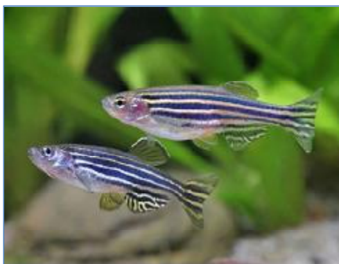
تصویر شماره ۱- ماهی گورخری برگرفته از

شیرین جهان دارد و به خوبی در صنعت آکواریوم و ماهیان زینتی اقصا نقاط جهان وارد شده است. از این ماهی برای کنترل بیولوژیک پشه در برخی نقاط دنیا (۲۵)، در صنعت آکواریوم و ماهیان زینتی (۲۶) و خصوصاً به عنوان یک گونه زیستی مدل ۶ در توسعه علوم مختلف زیست‌شناسی (۲۷ و ۲۸) استفاده می‌شود. به طور کلی ماهیان گورخری از زمان خروج از تخم (مرحله‌ی هچ شدن یا تخم‌گشایی) تا ۲۱ روز پس از آن مرحله‌ی نوزادی (ماهی نوزاد) ۷ ، از روز بیست و یکم تا نودمین روز مرحله‌ی جوانی (ماهی جوان) ۸ و پس از نود روز مرحله‌ی بلوغ (ماهی بالغ) ۹ را طی می‌کنند (۲۹).