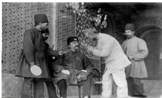
مسیوپلوکه: دندان‌پزشک فرانسوی در دوره‌ی ناصرالدین‌شاه