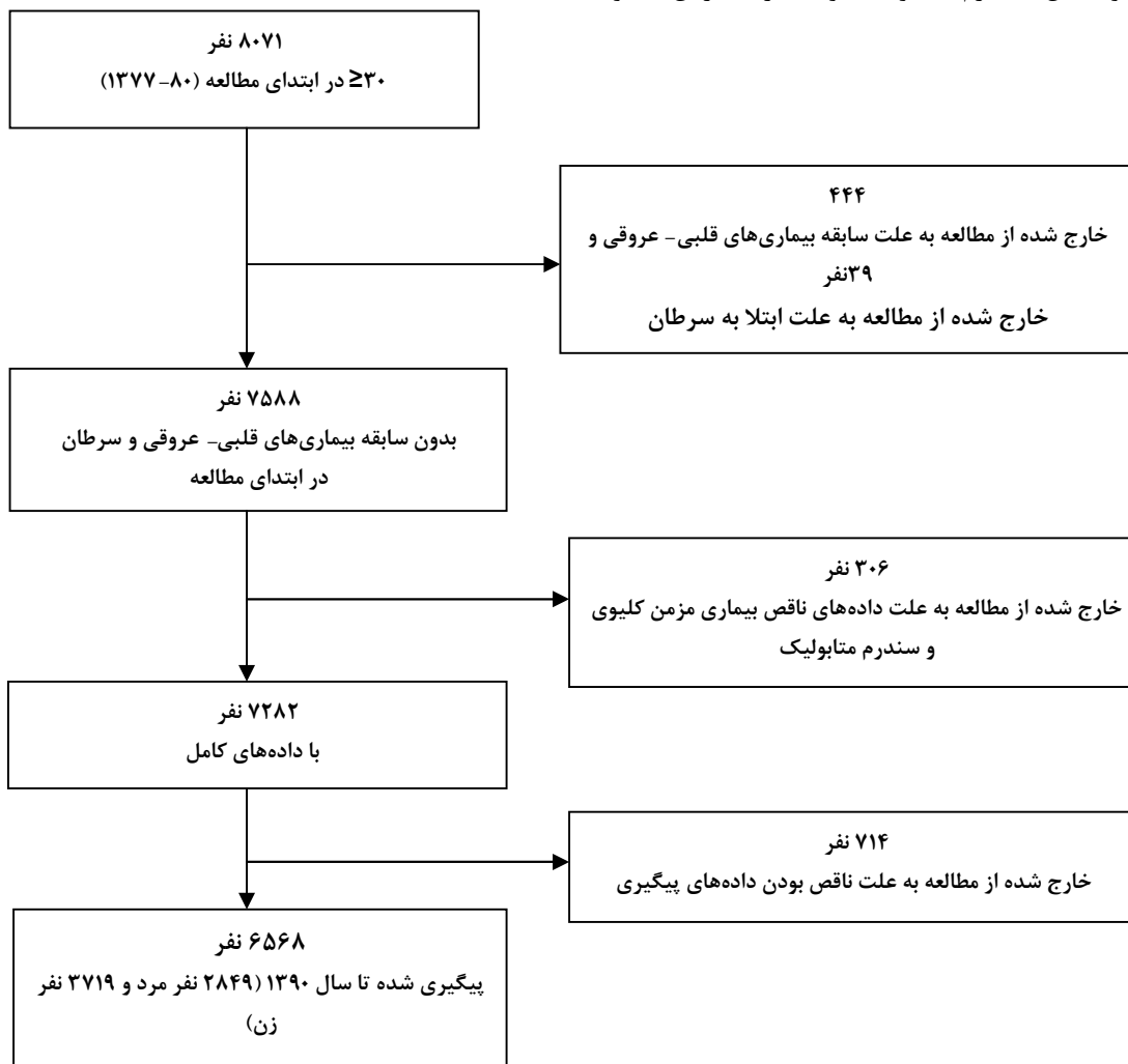
نمودار شماره ۱- فلوجارت جمعیت مورد مطالعه

دارای بیماری مزمن کلیوی و بدون سندرم متابولیک و همچنین مردان مبتلا به هر دو عامل بیماری مزمن کلیوی و سندرم متابولیک می‌باشد. نمودار ۴ نشان می‌دهد که در زنان، خطر بروز بیماری عروق کرونر قلب در افراد دارای بیماری مزمن کلیوی و بدون سندرم متابولیک به‌طور قابل ملاحظه‌ای بیشتر از زنان دارای سندرم متابولیک و بدون بیماری مزمن کلیوی و همچنین زنان دارای هر دو عامل سندرم متابولیک و بیماری مزمن کلیوی