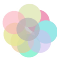
شکل ۴- وجود ثبات درونی و عدم تک‌بعدی بودن مقیاس