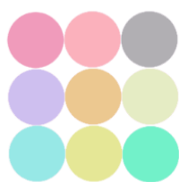
شکل ۲- عدم وجود ثبات درونی و تک‌بعدی بودن مقیاس

در شکل شماره ۳، نشان داده شده است که همه‌ی آیت‌ها حداقل با سایر آیت‌ها واریانس مشترک دارند. این نشان دهنده‌ی ثبات درونی بالا و تک‌بعدی بودن مقیاس است. اما در شکل شماره ۴، هر آیت فقط با برخی از آیت‌ها واریانس مشترک دارند. این نشان دهنده‌ی ثبات درونی بالا است، اما مقیاس اصلاً تک‌بعدی نیست.