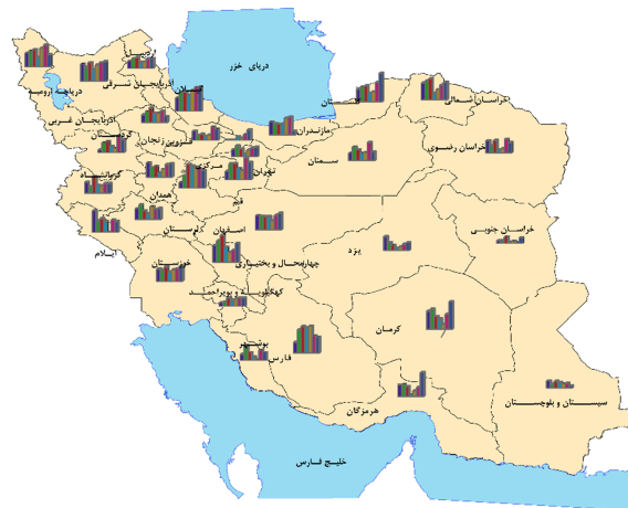
خانوارهای مواجهه یافته با مخارج کمرشکن سلامت (%)