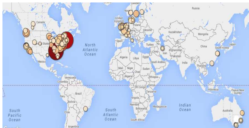
شکل شماره ۳- مصورسازی تولیدات علمی دانشگاه‌های برتر جهان در حوزه‌ی اپیدمیولوژی طی سال‌های ۲۰۱۱-۲۰۱۵ میلادی در پایگاه اسکوپوس (اندازه هر گره: تعداد مقاله‌های آن دانشگاه؛ طیف رنگ گره‌ها از زرد به قرمز: میانگین استنادی کم‌تر تا بیش‌تر)