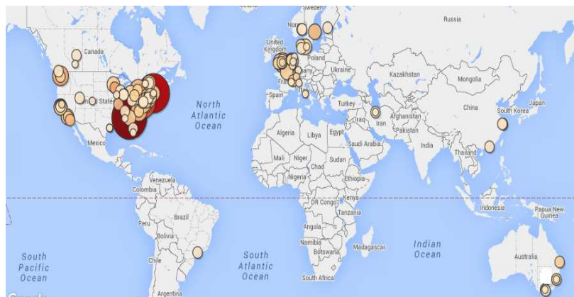
شکل شماره ۳- مصورسازی تولیدات علمی دانشگاه‌های برتر جهان در حوزه‌ی اپیدمیولوژی طی سال‌های ۲۰۱۱-۲۰۱۵ میلادی در پایگاه اسکوپوس (اندازه هر گره: تعداد مقاله‌های آن دانشگاه؛ طیف رنگ گره‌ها از زرد به قرمز: میانگین استنادی کم‌تر تا بیش‌تر)