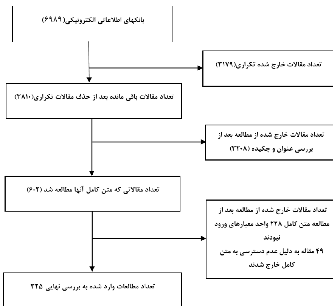
شکل شماره ۱- فلوچارت فرایند انتخاب مقاله‌ها در مرور ساختاریافته سطح پوشش واکسن پنوموکوک

کونزوگه ۱۳ ظرفیتی پنوموکوک که شامل: B, 9V, 14, 18C, 6,4, 19F, 23F, 1, 5, 7F, 3, 6A, 19A غیراختصاصی واکسن کونزوگه ۱۳ ظرفیتی پنوموکوک شامل سروتایپ‌های F,15A/B,35B, 11A۸,۱۲ تقریباً در تمامی مناطق مشترک هستند. البته اختلافاتی از نظر شیوع سروتایپ هر منطقه با منطقه دیگر وجود دارد. سروتایپ‌های شایع استرپتوکوک پنومونیه به ترتیب شیوع، در کشورهای دریافت‌کننده، پس از دریافت واکسن به تفکیک مناطق