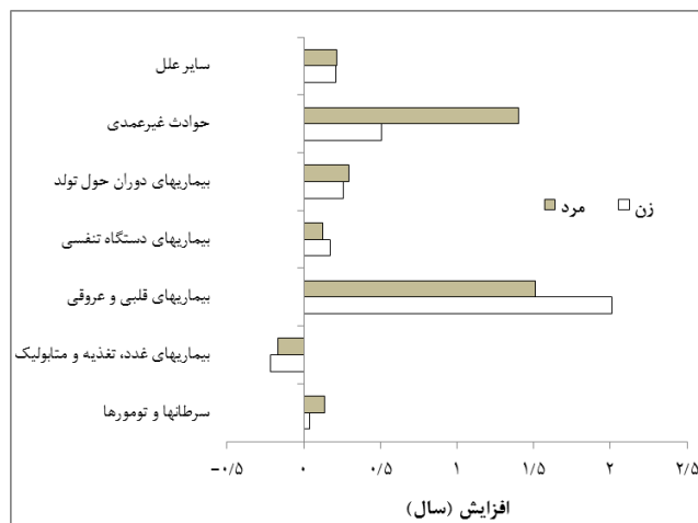
نمودار شماره ۳- سهم علل اصلی مرگ در افزایش امیدزندگی در کشور بر حسب جنس ۱۳۸۵-۹۵