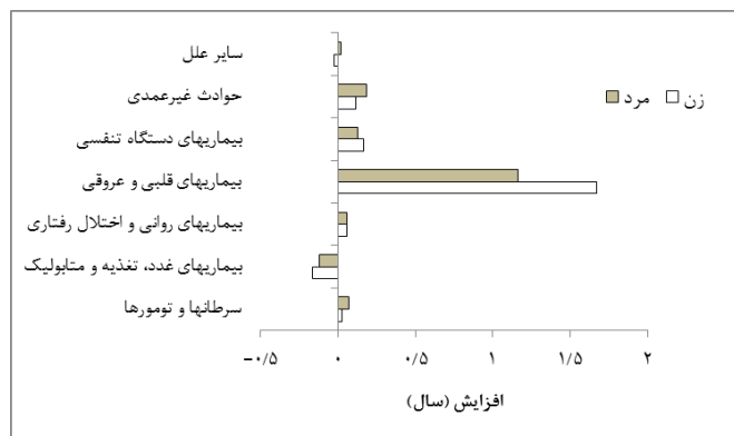
نمودار شماره ۴- نقش سنین سالمندی در افزایش امیدزندگی در کشور به تفکیک علل اصلی مرگ بر حسب جنس، ۱۳۸۵-۹۵