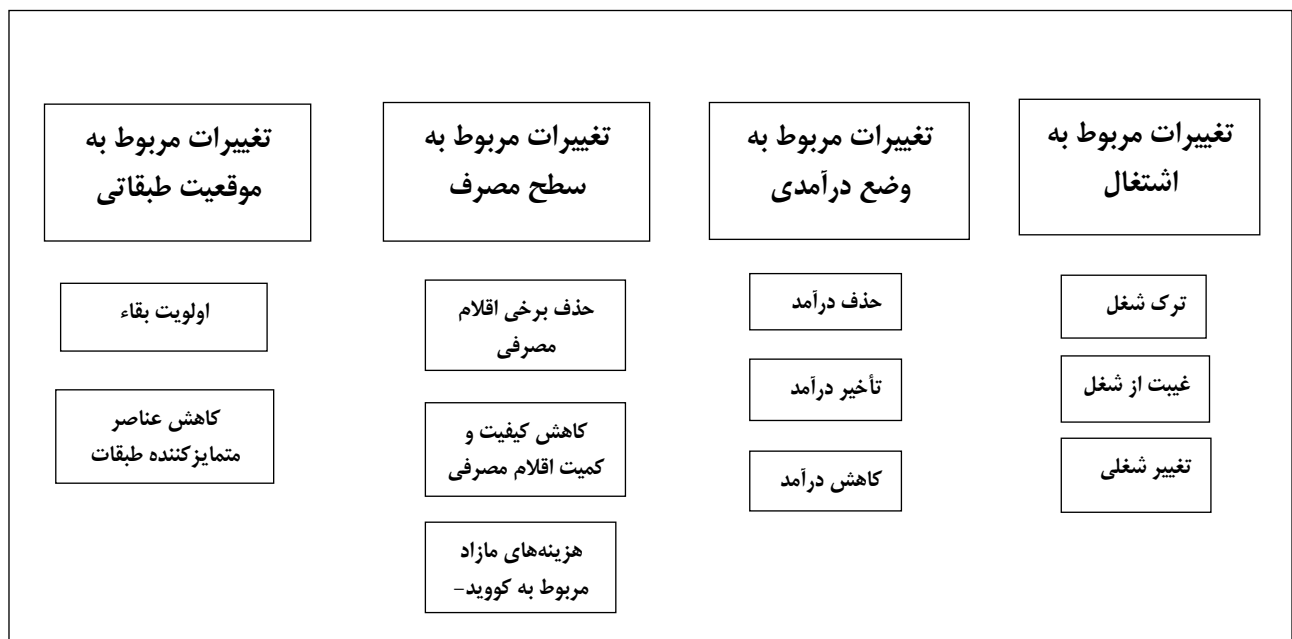
نمودار شماره ۱- سطوح خرد تاب‌آوری اقتصادی خانواده در مواجهه با کووید-۱۹

بر اساس یافته‌های این مطالعه یکی دیگر از ابعادی که می‌تواند در شرایط بحران تغییر کند، موقعیت طبقاتی افراد و خانواده‌ها است. در واقع در موقعیت بحران، موضوع بقاء، اولویت می‌یابد، و این می‌تواند در برخی از افراد که در سلسله مراتب اجتماعی، پایگاه بالاتری داشتند، ایجاد نارضایتی نماید و تلاش آن‌ها را برای حفظ پایگاه خود برانگیزد. یافته‌های این مطالعه نشان داد برخی افراد به این منظور، پای‌بندی و رعایت بیشتری نسبت به پروتکل‌های بهداشتی نشان می‌دهند. در واقع چنین به نظر می‌آید در محله‌ای که بیشتر افراد توان خرید ماسک و مواد ضدعفونی را نداشتند، افراد با موقعیت بالاتر، با حفظ فاصله فیزیکی و استفاده بیشتر از شوینده‌ها و ماسک، تا حدی فاصله طبقاتی خود را حفظ می‌کنند. در یافته‌های ما برخی خانواده‌هایی که موقعیت اجتماعی- از دیدگاه تحصیلی و شغلی- بالاتری داشتند، در این شرایط به کمک خانواده‌های ضعیف‌تر رفته و با عضویت در خیریه