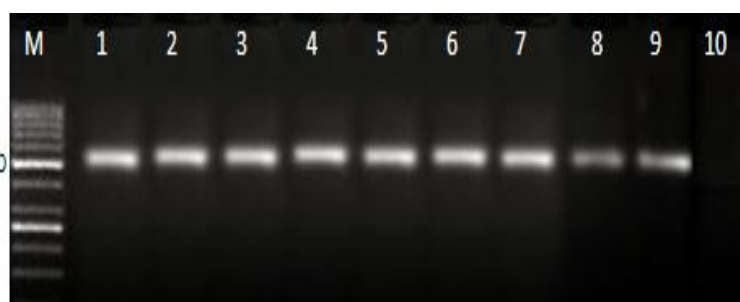
شکل شماره ۲- ژل آگارز ۲٪ مربوط به PCR به‌دست‌آمده از DNA برخی جدایه‌های استرپتوکوکوس اینیایی به‌دست‌آمده از مزارع قزل‌آلای چهارمحال و بختیاری و کهگیلویه و بویر احمد، M = نشانگر، ۱-۸ = جدایه‌های مورد آزمایش، ۹ = کنترل مثبت (استرپتوکوکوس اینیایی GQ8503771)، ۱۰ = کنترل منفی (لاکتوکوکوس گارویه GQ8503761)

است. همچنین، ۷ کارگاه (۱۴٪) از مزارع دو استان در زمان نمونه‌گیری هیچ‌گونه بیماری باکتریایی نداشتند. نتایج این مطالعه نشان می‌دهد که افزون بر بیماری‌های استرپتوکوکوزیس و لاکتوکوکوزیس برخی کارگاه‌های قزل‌آلای این استان‌ها به برخی سپتی سمی‌های باکتریایی دیگر نیز مبتلایند. زیرا در ۶ کارگاه (۱۲٪) استان‌های پیش‌گفته نتایج نمونه‌گیری کشت باکتریایی به جداسازی ایزوله‌های باکتریایی از نوع گرم مثبت و گرم منفی منجر گردید که نیازمند مطالعه‌های بیشتر است.