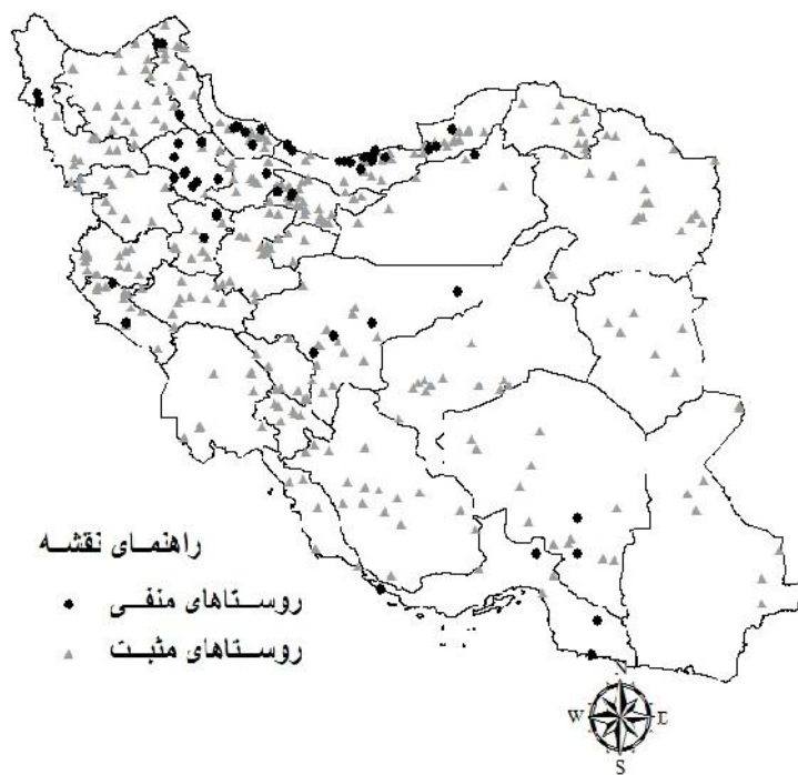
تصویر شماره ۱- نقشه روستاهای نمونه‌گیری شده در سال ۱۳۹۲ در سراسر کشور، دایره‌های تیره روستاهای سرم منفی و مثلث‌های خاکستری روستاهای سرم مثبت را نشان می‌دهد.

* آب و هوای خزری پایه و بقیه با آن مقایسه شده است.