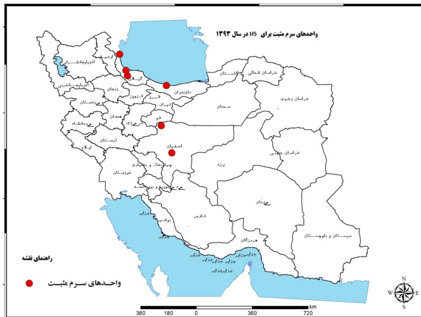
شکل شماره ۲- واحدهای سرم مثبت برای آنفلوانزای H5 در سال ۱۳۹۳