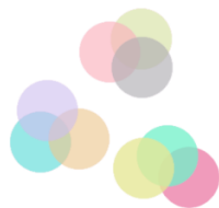
شکل ۴- وجود ثبات درونی و عدم تک‌بعدی بودن مقیاس