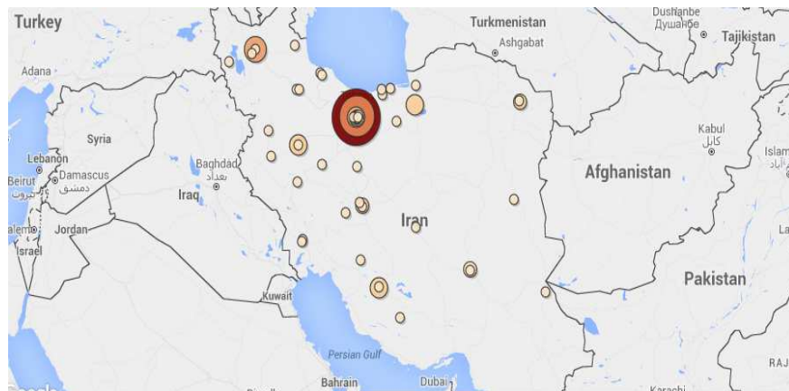
شکل شماره ۵- مصورسازی تولیدات علمی دانشگاه‌های برتر ایران در حوزه اپیدمیولوژی طی سال‌های ۲۰۱۱-۲۰۱۵ میلادی در پایگاه اسکوپوس (اندازه هر گره: تعداد مقاله‌های آن دانشگاه؛ طیف رنگ گره‌ها از زرد به قرمز: میانگین استنادی کم‌تر تا بیش‌تر)