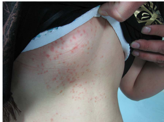
شکل ۲: پاپول‌های قرمز روی سینه و شکم.

از نظر بالینی، سیرینگوما ممکن است با هایپرپلازی سباسه، آکنه ولگاریس، میلیا، گزانتوما بثوری، کهیر رنگدانه‌ای، هیدروسیتوما، تریکوآپیتلیوما و گزانتلازما در صورت و گرانولوم آنولر در تنه اشتباه شود. ۳