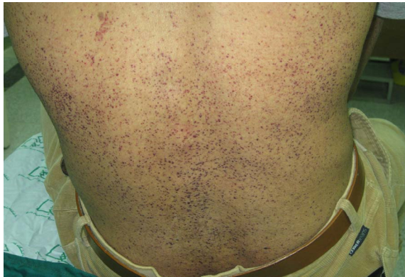
شکل ۱: ماکول‌ها و پاپول‌های قرمز تیره‌ی کراتوتیک منتشر روی بدن بیمار.

مناسب از ایجاد عوارض و درگیری‌های سیستمیک این بیماری کاسته شود.