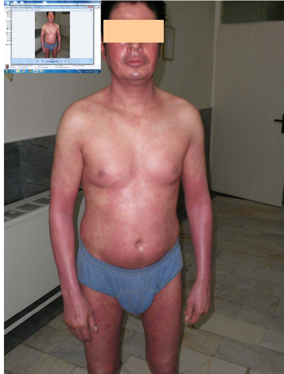
تصویر ۱: بچ و پلاک های اریتماتو متعدد در تنه، صورت و اندامها همراه پوسته ریزی و پوست خشک.

طی ۶ ماه گذشته بیمار در مرکز دیگری با تشخیص احتمالی پسوریازیس تحت درمان با نئوتیگازون به میزان ۲۵ میلی گرم روزانه و استروئید موضعی قرار گرفته بود که نتیجه ی مناسبی حاصل نشده و حتی ضایعات رو به بدتر شدن رفته بود. ما ابتدا یک اسمیر مستقیم از ضایعات با خراشاندن