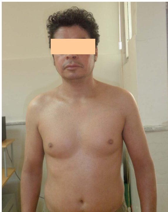
تصویر ۳: بعد از درمان با فلوکونازول خوراکی و کلوتریمازول موضعی، ضایعات کاملاً ناپدید شد.

بعد از توقف مصرف استروئید موضعی، بیوپسی های متعدد از نقاط مختلف انجام شد که در بررسی آسیب شناسی در پس زمینه ی ایکتیوز، قارچ های متعدد PAS + در لایه ی شاخی اپیدرم ظاهر شد (تصویر ۲). اسمیر مستقیم نیز تکرار شد که آن هم میسلیوم های شاخه شاخه را نشان داد. کشت قارچ از نظر تریکوفیتون روبروم مثبت شد. هیچ منبع خاصی برای درماتوفیتوز بیمار پیدا نشد و بیمار سابقه تماس با هیچ حیوانی را نداشت. بیمار با فلوکونازول خوراکی روزانه ۱۰۰ میلی گرم و کلوتریمازول موضعی به مدت یک ماه درمان شد. به علت پاسخ دراماتیک، درمان با فلوکونازول خوراکی به میزان ۱۵۰ میلی گرم در هفته به مدت ۷ هفته دیگر ادامه داده شد تا این که ضایعات کاملاً برطرف (تصویر ۳) و نتیجه ی اسمیرهای مستقیم از نظر وجود قارچ منفی شد.