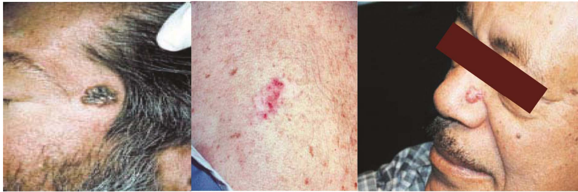
شکل ۱: انواع کارسینوم سلول بازال؛ الف) ندولار (ب) سطحی (ج) pigmented ۶

ناحیه‌ی بینی است. در ۱۵٪ الی ۴۳٪ موارد ناحیه‌ی گردن درگیر می‌شود. ۲۰٪ موارد بروز کارسینوم سلول بازال در ناحیه‌های پوستی که کمتر در معرض تابش نور خورشید می‌باشند، دیده می‌شود. نئوپلاسم‌های ناحیه‌ی حفاظت‌شده در مقابل نور و یا در نواحی چین‌دار، خطرناک‌تر می‌باشند زیرا دیر تشخیص داده شده و ممکن است باعث پیش‌آگهی بد، مرگ‌ومیر حین عمل جراحی و متاستاز شوند. ۳