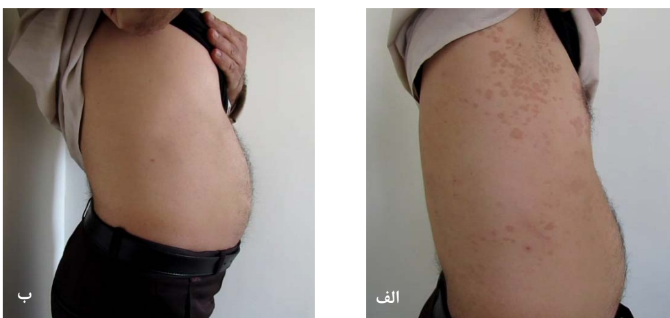
شکل ۲: تأثیر استفاده از شامپوی کتوکونازول ۲٪ بر بیمار مبتلا به پیتیریا‌زیس ورسیکالر؛ الف) قبل از درمان، ب) بعد از ۳ هفته درمان.

جدول ۱: میزان بهبودی عوارض و علائم در بیماران مبتلا به پیتیریا‌زیس ورسیکالر پس از ۳ هفته استفاده از شامپوی کتوکونازول ۲٪