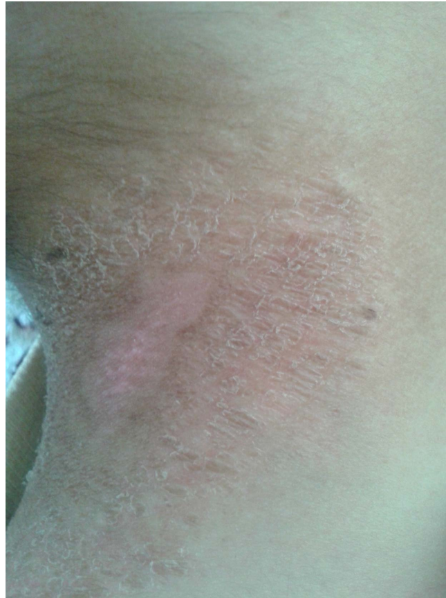
شکل ۷: درماتیت پدروسی ۲۷ روز پس از تماس با حشره.

محل‌های استراحت شبانه‌ی خود در مناطق آلوده به این موضوع توجه نمایند. باید از کشتن حشرات بر روی پوست خودداری کرده و آن‌ها را به‌آهستگی از روی پوست برانند. از آن‌جا که این حشرات شب‌ها بیشتر فعال هستند، باید نکات ایمنی در نزدیکی منابع نورانی را رعایت کرد. کودکان به‌سبب برخورداری از پوست نازک‌تر نسبت به گزش این حشره آسیب‌پذیرتر هستند.