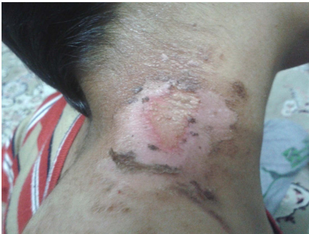
شکل ۶: درماتیت پدروسی ۹ روز پس از تماس با حشره.