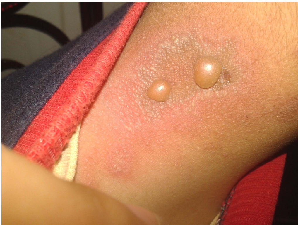
شکل ۳: درماتیت پدروسی یک روز پس از تماس با حشره.