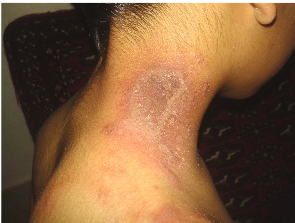
شکل ۴: درماتیت پدروسی سه روز پس از تماس با حشره.