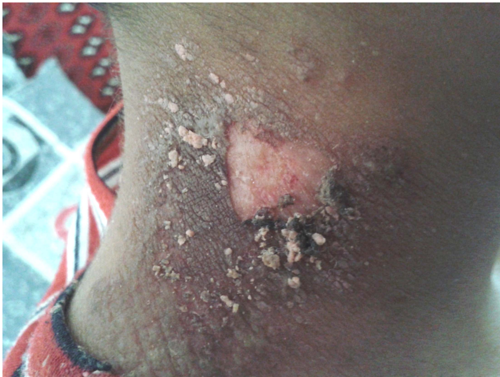
شکل ۵: درماتیت پدروسی ۶ روز پس از تماس با حشره.