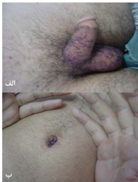
شکل ۱: ضایعات پوستی مشخصه‌ی بیماری فابری؛ الف) آنژیوکراتوم‌های متعدد روی اسکروتوم و آلت تناسلی، ب) آنژیوکراتوم‌های متعدد در اطراف ناف (periumbilical rosette)

کوچک به‌رنگ قرمز تیره به‌خصوص روی پهلوها، ران‌ها، ناحیه‌ی تناسلی و اطراف ناف که از کودکی ایجاد شده بودند، مشاهده شد (شکل ۱). در معاینه‌ی چشم تلانژکتازی ملتحمه و cornea verticillata مشاهده شد. در شنوایی‌سنجی، اختلال در رفلکس آکوستیک وجود داشت. الکتروکاردیوگرام و آزمایشات ادراری به‌عمل آمده طبیعی بودند. به‌منظور بررسی بیشتر برای بیمار مشاوره‌های مختلفی ازجمله نورولوژی، قلب و اورولوژی درخواست شد که به‌دلیل اعزام وی به خدمت سربازی انجام نشدند. در بیوپسی انجام‌شده هیپرکراتوز، آکانتوز، پاپیلوماتوز و پرولیفراسیون‌های عروقی متسع با یک لایه پوشش آندوتلیال صاف در درم پاپیلر مشاهده شد (شکل ۲).