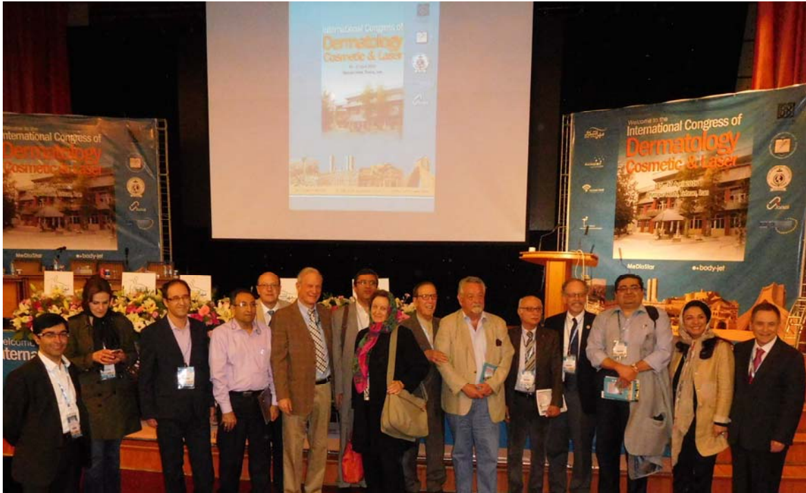
Fig 1. The Congress assembled