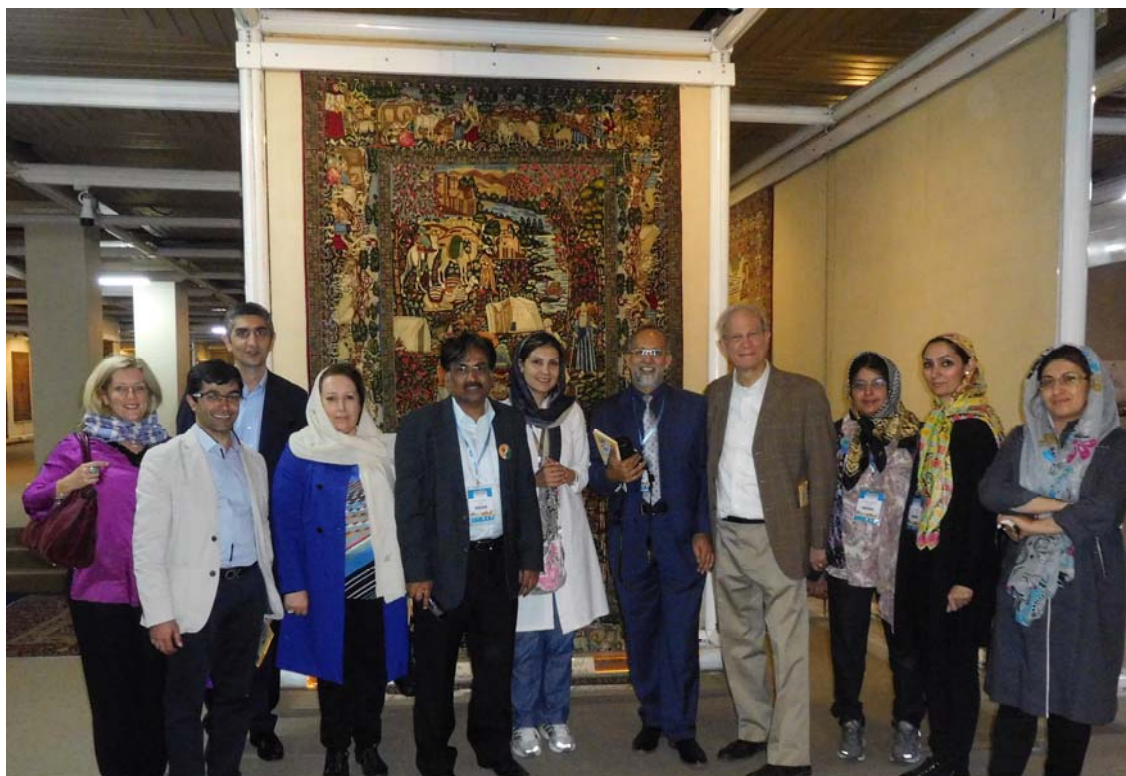
Fig 6. Tehran's famous Carpet Museum attracts congress guests