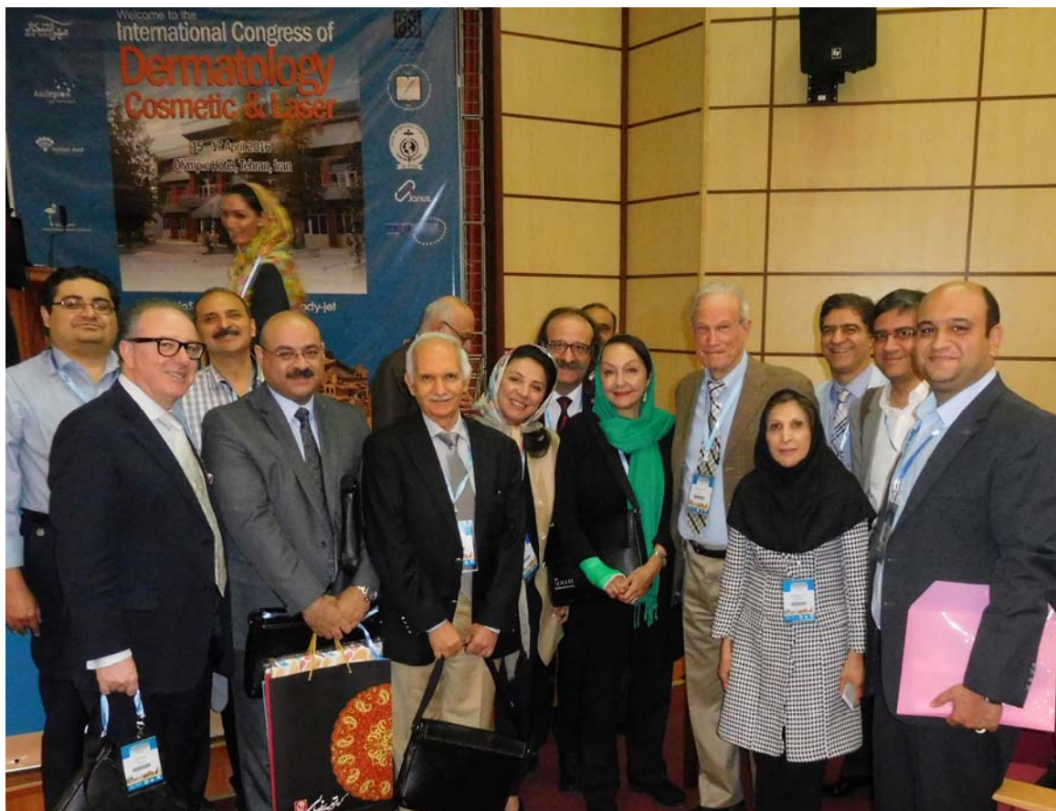
Fig 9. Closing ceremony with grateful attendees