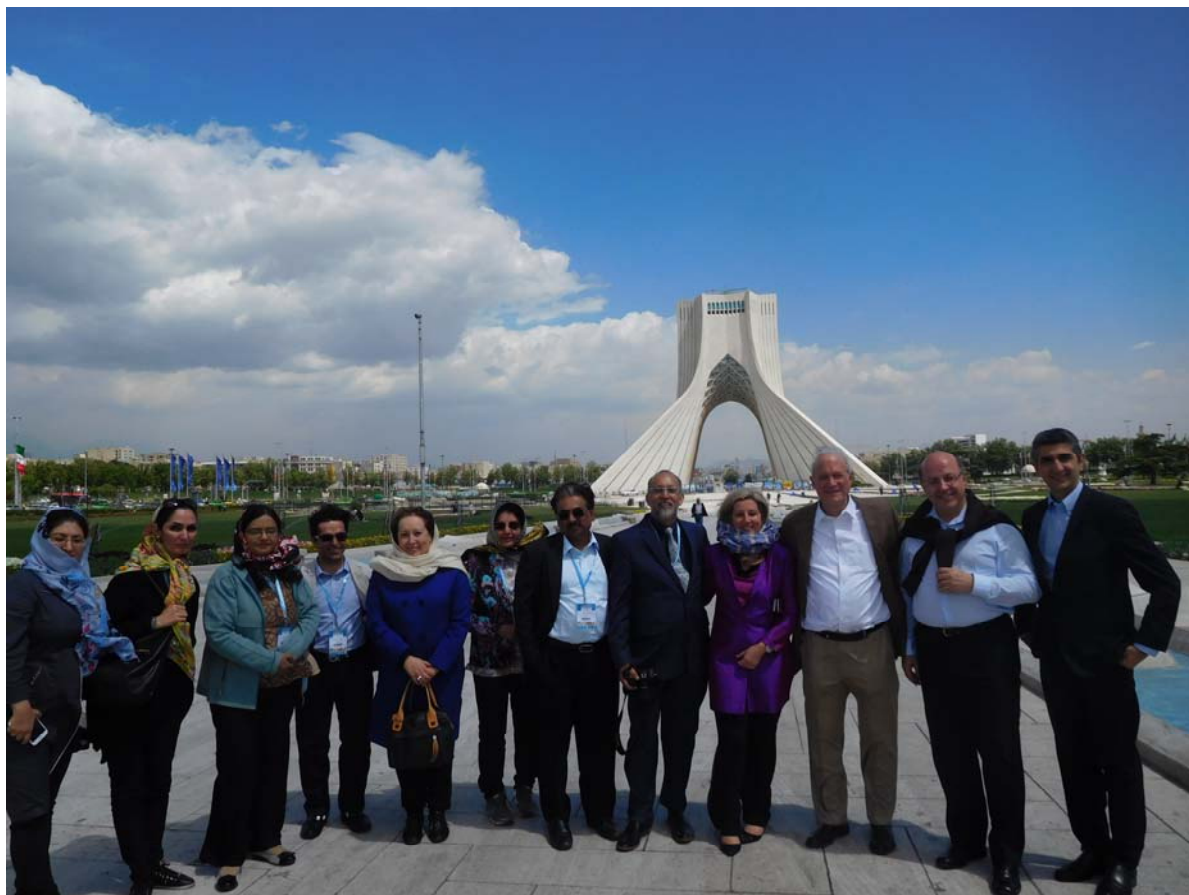
Fig 7. Azadi (Freedom) Monument, Tehran, with admiring congress attendees