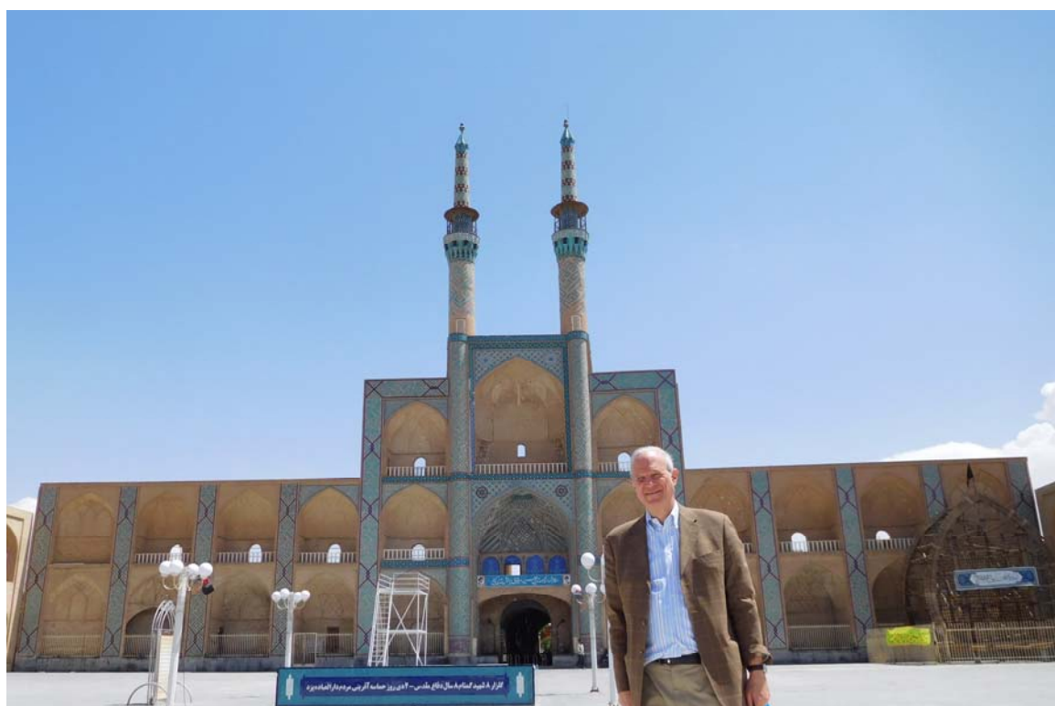
Fig 8. Ancient desert city of Yazd with its magnificent Amir Chahmaq Complex