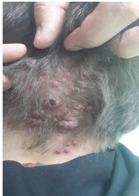
شکل ۱: پاپول ندول‌های اریتماتوی متعدد در ناحیه‌ی پس‌سری که برخی ضایعات به‌علت خارش دچار خونریزی سطحی شده‌اند.

هر ضایعه ابعادی بین ۰/۵ تا ۱ سانتی‌متر داشت و به‌علت خارش مزمن، پوست اطراف ضایعات لیکنیفیه شده و برخی ضایعات نیز زخمی شده بود. علائم حیاتی بیمار طبیعی بود و به‌جز خارش خفیف تا متوسط شکایت بالینی دیگری نداشت. بیمار سابقه‌ی بیماری سیستمیک، عفونت موضعی و تروما در ناحیه را ذکر نمی‌کرد. در سابقه‌ی مصرف دارویی بیمار، هیچ دارویی وجود نداشت. در ماه هشتم حاملگی دوم خود به‌سر