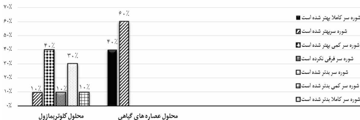
شکل ۳: میزان رضایت داوطلبین

درمان‌های مختلف شیمیایی و گیاهی برای شوره‌ی سر و درماتیت سبورئیک موجود است. از سال‌ها قبل در بسیاری از نقاط جهان از خواص درمانی متعددی که گیاهان داشتند در درمان بسیاری از بیماری‌ها از جمله شوره‌ی سر استفاده می‌شد. گیاهان با خواص دارویی می‌توانند درمان ارزان‌تر و بی‌خطرتری نسبت به بسیاری از داروهای شیمیایی باشند. مطالعات مختلفی در ارتباط با اثر ضدشوره‌ی برخی گیاهان