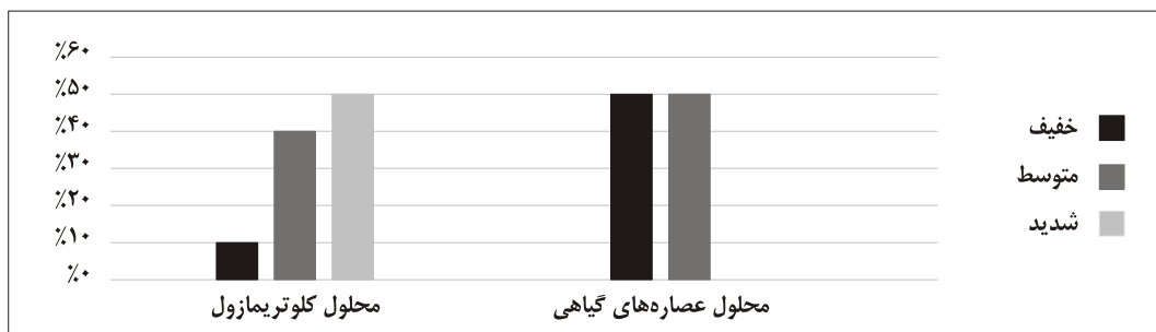
شکل ۱: امتیاز IGA در بدو ورود

در رابطه با خارش در گروهی که محلول کلوتریمازول را دریافت کردند، در هفته‌ی دوم P=0/037 و در هفته‌ی چهارم P=0/003 کاهش