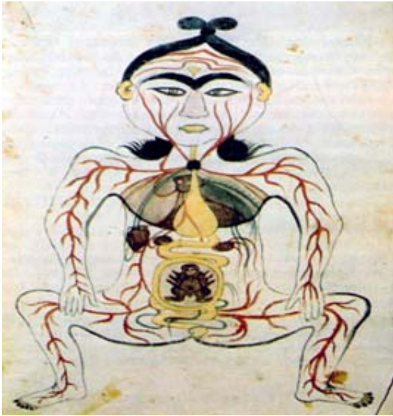
شکل ۱: نمایی از پراکندگی عروق خونی در سطح پوست از کتاب تشریح الابدان

عروق خونی فراوان و نیز مجاورت با عضلات در لایه‌های زیرین پوست دانسته شده است. در پوست منافذ باریک بسیاری وجود دارد که «مسام» نامیده می‌شوند. عضلاتی که در بخش زیرین پوست قرار گرفته‌اند نیز حاوی حس می‌باشند تا چنانچه به پوست آسیبی برسد، عضلات در زمینه دریافت حس لامسه جانشین پوست باشند. ۱۹