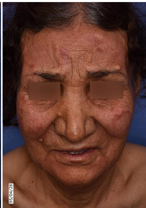
شکل ۱ الف: پلاک‌های انفیلتره و اریتماتو در هر دو گونه