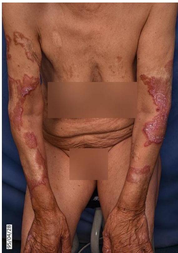
شکل ۱ ب: پلاک‌های انفیلتراتیو و وروکوز در محل اسکارهای سوختگی

بیمار از خارش شدید ضایعات شاکی بود. هیچ یافته‌ی فیزیکی دیگری دیده نشد. هم‌چنین بیمار