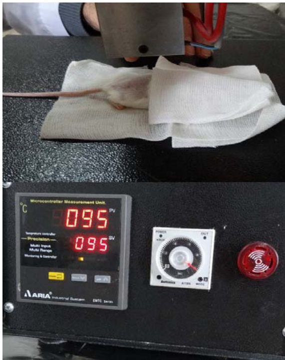
شکل ۱: روش ایجاد سوختگی درجه‌ی سوم در ناحیه‌ی پشتی موش سوری با دستگاه ویژه. دمای صفحه ۹۵ درجه‌ی سانتی‌گراد و مدت تماس صفحه‌ی داغ با پوست ۱۰ ثانیه بود.

برای تهیه‌ی ترکیب روغن زیتون و آب آهک به روش سنتی، ابتدا ۱۰۰ گرم آهک کاملاً خشک و بدون رطوبت در ۲۰۰ میلی‌لیتر آب حل شده و بعد از