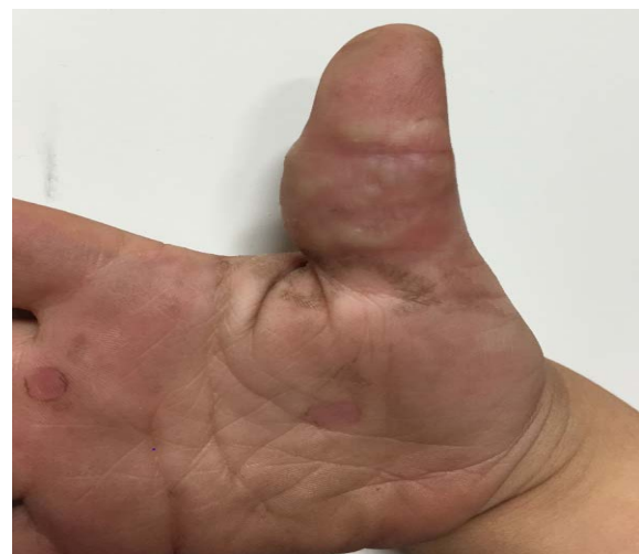
شکل ۱: ندول‌های زیرجلدی در سطح شکمی انگشت متورم شست راست

گرانولوم آنولر یک بیماری پوستی التهابی خوش‌خیم و با علت نامعلوم است که یافته‌های آسیب‌شناسی آن به صورت palisading granuloma می‌باشد. گرانولوم آنولر شامل یک نوع کلاسیک و واریانت‌های کمتر معمول به نام‌های منتشر، پرفوران، ناشی از دارو و نوع آتیپیک که در بچه‌های با نقص ایمنی اولیه گزارش شده است ۱،۲ . گرانولوم آنولر زیرجلدی به‌عنوان یک واریانت نادر که انحصاراً در بچه‌ها رخ می‌دهد شناخته می‌شود و ابتلا به آن پس از دهه‌ی دوم زندگی نادر است. این فرم می‌تواند تنها یا به همراه گرانولوم آنولر لوکالیزه (۲۵٪) در یک نقطه یا نقطه‌ای دیگر از بدن قبل، بعد یا هم‌زمان با آن دیده شود. گرانولوم آنولر زیرجلدی در هیستولوژی نواحی