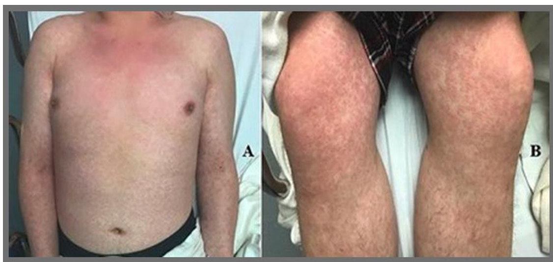
شکل ۱: راش گسترده ماکولوپاپولر در بیمار ۲۰ ساله

در ۱۷ مارچ ۲۰۲۰ یک مورد جالب در مجله‌ی JAAD گزارش شده که به بررسی یک بیمار تایلندی با تشخیص اولیه‌ی Dengue viral hemorrhagic fever پرداخته است. بیمار در ابتدا بدون تب و علائم تنفسی و تنها با راش پوستی همراه با پورپورا و پلاکت پایین به پزشک مراجعه می‌کند و با توجه به شیوع بالای تب