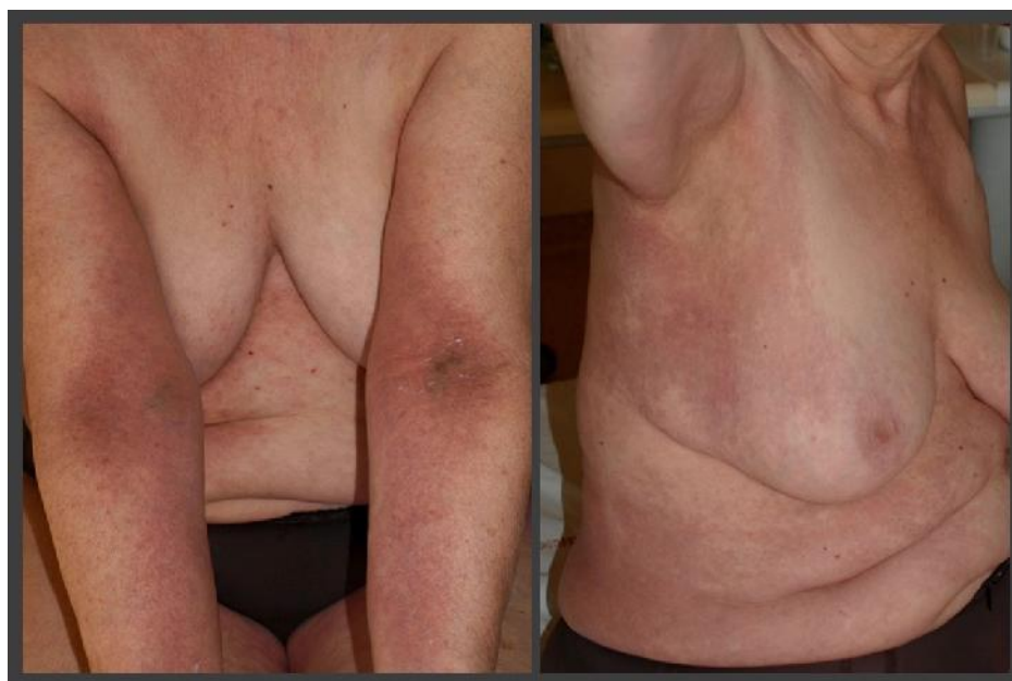
شکل ۲: راش اریتماتو در ناحیه انته کوبیتال در بیمار دیابتیک

یک خانم ۶۴ ساله‌ی دیابتیک، ۴ روز پس از شروع تب ۴۰ درجه و ضعف جنرالیزه، دچار راش اریتماتو در ناحیه‌ی انته کوبیتال دوطرف با گسترش به ناحیه‌ی تنه و زیر بغل می‌شود و به تدریج سرفه نیز به علائم بیمار اضافه می‌شود. علائم پوستی بیمار پس از گذشت ۵ روز و تب و علائم تنفسی در عرض ۱۸ روز بهبود پیدا می‌کنند. براساس درگیری سی تی اسکن ریه و PCR بیمار تشخیص کووید ۱۹ گذاشته می‌شود. در این مطالعه راش بیمار یادآور -Symmetrical Drug-Related Intertriginous and Flexural Exanthema (SDRIFE) بوده که بیشتر در همراهی با مصرف برخی داروها گزارش شده؛ البته به ندرت در برخی از مطالعات همراهی این ضایعه با عفونت‌های ویروسی همچون