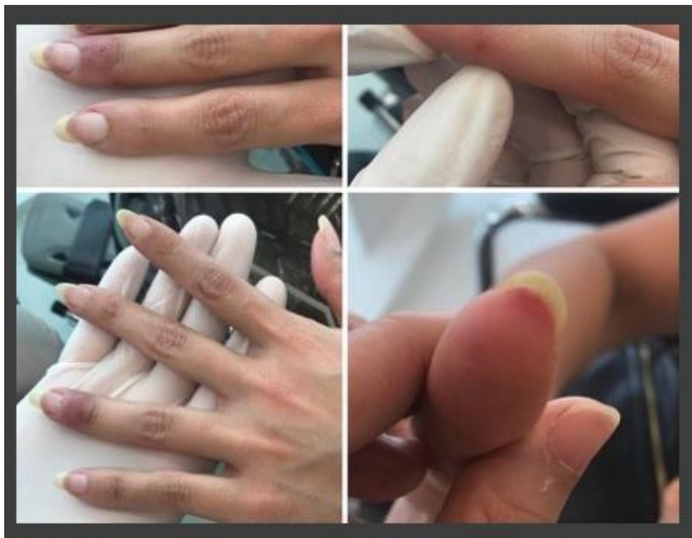
شکل ۷: راش ماکولوپاپولر در دو بیمار کووید ۱۹ بدون علائم تنفسی و تب

براساس این مطالعه، یافته‌های پوستی نیز از تظاهرات ناشایع این بیماری بوده و تشخیص آن‌ها از اهمیت بسزایی در شناسایی و درمان بیماری کووید ۱۹ و جلوگیری از انتقال آن در سطح جامعه برخوردار است.