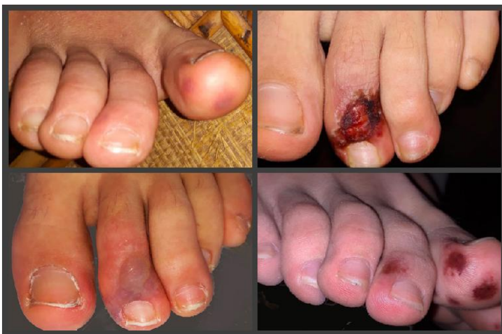
شکل ۶: ضایعات عروقی در انتهاها در بیماران کووید ۱۹

از نظر کووید ۱۹ انجام نشده اما همزمانی گسترش این تظاهرات پوستی در سراسر جهان و همه‌گیری جهانی