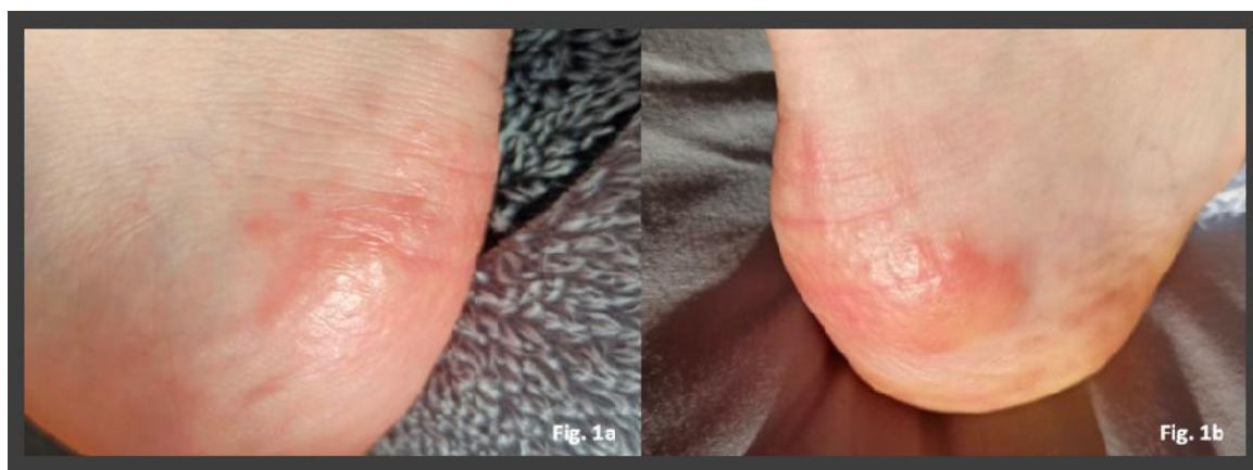
شکل ۳: پاپول‌های قرمز متمایل به زرد، ۱۳ روز پس از تشخیص کووید ۱۹

تا کنون براساس آمار ذکرشده، شیوع بیماری کووید ۱۹ در افراد زیر ۱۹ سال تنها ۲٪ گزارش شده که ۹۰٪ از آن‌ها با علائم بسیار خفیف یا به‌طور کلی