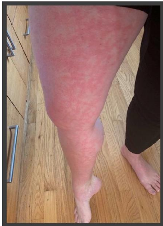
شکل ۵: ضایعات لیودورتیکولاریس

با در نظرگیری این مطالعه و گزارشات قبلی می‌توان ایسکمی نواحی اکراال را تظاهر نادری از بیماری کووید ۱۹ دانست و متخصصان درماتولوژی به‌عنوان خط اول مواجهه با بیمارانی با این تظاهرات پوستی، باید همواره بیماری کووید ۱۹ را در نظر داشته باشند ۱۵ .