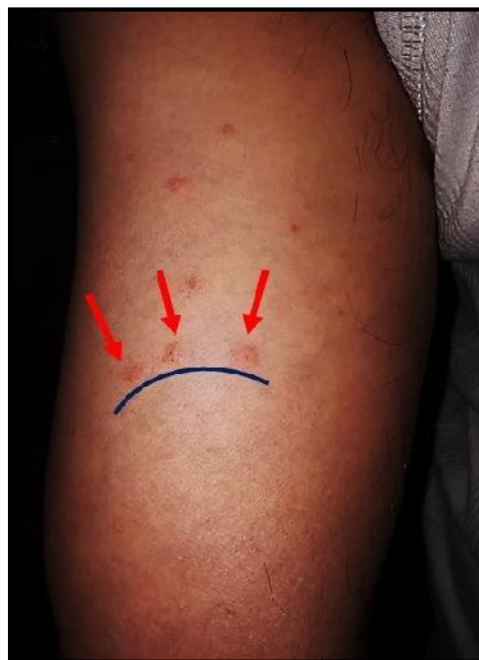
شکل ۳: ترکیب خطی بر روی بازوی فرد «صبح، ظهر و شب»

نتایج مطالعه وانگ و همکاران (۲۰۱۶) نشان داد که تنها ۶۸٪ از ساکنین منازل آلوده نسبت به گزش