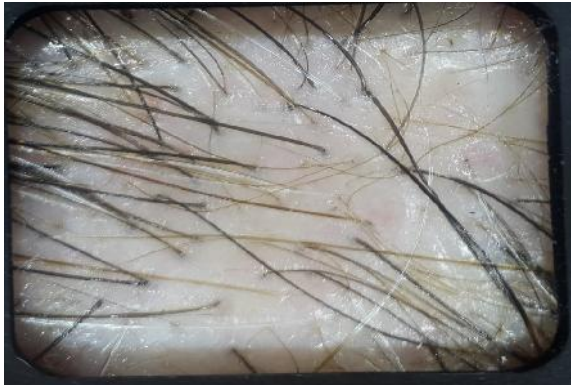
شکل ۱: تفاوت (هتروژنیته) در ضخامت ساقه‌ی مو در آلوپسی آندروژنتیک