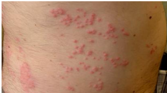
شکل ۷: بثورات دریا

بثورات می‌تواند ۳ تا ۷ روز و گاهی اوقات تا ۶ هفته ادامه یابد. درمان شامل استفاده از کمپرس یخ، آنتی‌هیستامین خوراکی و کورتیکواستروئید موضعی با قدرت متوسط است.