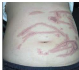
شکل ۶: گزش عروس دریایی

گزش عروس دریایی یا man-of-war stings به‌طور عادی در بین شناگران آب شور دیده می‌شوند و می‌توانند در سواحل هم وجود داشته باشند (شکل ۶). بیش از ۱۰۰ عروس دریایی سمی وجود دارد و علائم گزش از سوزش و خارش آزاردهنده تا مرگ متغیر است. شایع‌ترین تظاهرات پوستی، سوزش فوری و به دنبال آن ضایعات کهیری در یک توزیع خطی است. گاهی اوقات، ممکن است ضایعات گرانولوماتوز ایجاد شود و هفته‌ها تا ماه‌ها ادامه یابد.