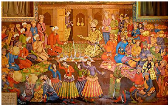
شکل ۲: ترسیم از ایرانیان خضاب‌شده در دوران شاه عباس کبیر در مجلس شاهی.

گاسپار دروویل، صاحب منصب نظامی و سفرنامه‌نویس فرانسوی است که در سال‌های ۱۸۱۳-۱۸۱۲ در پانزدهمین سال سلطنت فتحعلی‌شاه قاجار و ولایت‌عهدی عباس میرزا در ایران اقامت داشته است.