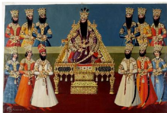
شکل ۳: ترسیمی از چهره خضاب‌شده و زیبای فتحعلی شاه و درباریان ایران در دوره قاجار (موزه لوور).

دروویل معتقد است ایرانی‌ها همیشه ریش و موی سر را در حمام رنگ می‌کنند. این عمل به سادگی انجام می‌گیرد و از خطرات ناشی از استعمال داروهایی که شارلاتان‌های لندن و پاریس به این اسم به قیمت طلا می‌فروشنند، به دور هستند و بالعکس برای مو فوق‌العاده مفید است؛ زیرا باعث نمو و پرپشت شدن آن می‌گردد. به این منظور از گرد بسیار نرمی که از ساییدن برگ خشک‌شده درخت رنگ به دست می‌آید، استفاده می‌نمایند. گرد مزبور را در مقدار کمی آب می‌خیسانند و خمیر شلی از آن تهیه می‌کنند.