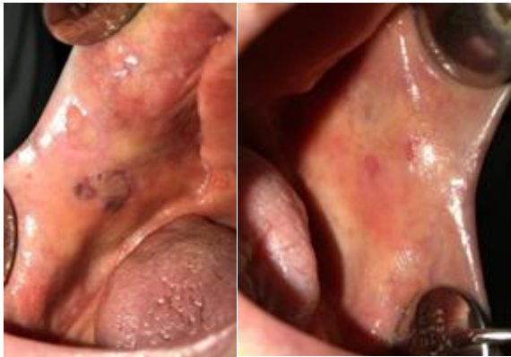
شکل ۱: زخم‌ها و اروژن‌های متعدد در مخاط باکال.