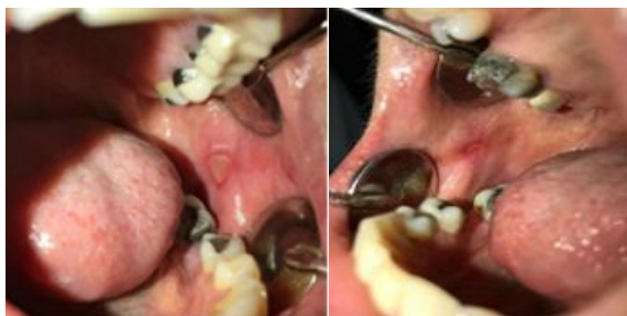
شکل ۲: زخم‌های دوطرفه.

و کاهش تعداد کلنی نسبت به گروه مواجهه با نیستاتین نیز دیده شد ( P < 0/001 ) (شکل ۳). در گونه‌های مقاوم لیزرخورده با ۸۱۰ نانومتر، تعداد کلونی‌ها به‌طور معنی‌داری کاهش و تقریباً به نصف رسیده بود ( P < 0/001 ) و کاهش تعداد کلنی نسبت به گروه مواجهه با نیستاتین نیز دیده شد ( P < 0/001 ) (جدول ۱). گروه کنترل مثبت پلیت حاوی ک.آلبیکنس استاندارد بدون مواجهه با لیزر و نیستاتین بود و گروه کنترل منفی فقط شامل محیط کشت بود (جدول ۱). نتایج تست‌های حساسیت دارویی هیچ