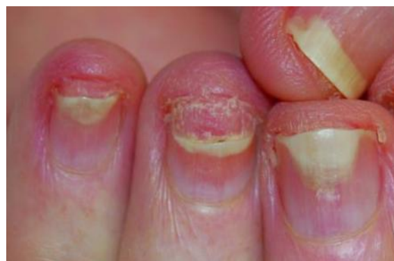
شکل ۲: پسوریازیس بستر ناخن با اونیکولیز.

در ناخن‌های پسوریازیس به‌جز اختلالات بافت ناخن، ناهنجاری‌هایی در مویرگ‌های خونی مطرح است که ممکن است منجر به کاهش دفاع طبیعی در برابر میکروارگانیسم‌ها شود. ۱۴ علاوه بر این، اونیکولیز (جداسدن صفحه ناخن) باعث ایجاد یک محیط مرطوب می‌شود که به نفع تکثیر قارچ می‌باشد. ۱۵ شایع‌ترین ویژگی‌های بالینی اونیکومایکوزیس، هایپرکراتوز زیر ناخی، اونیکولیز و تغییر رنگ می‌باشد؛ بنابراین اونیکومایکوزیس می‌تواند شبیه به پسوریازیس ناخن باشد و بعضی اوقات تشخیص و تفکیک بالینی آن‌ها از یکدیگر بسیار دشوار می‌شود. ۱۶ با توجه به اینکه همراهی این دو بیماری در جمعیت عمومی بسیار شایع است؛ بنابراین پزشکان برای تأیید /