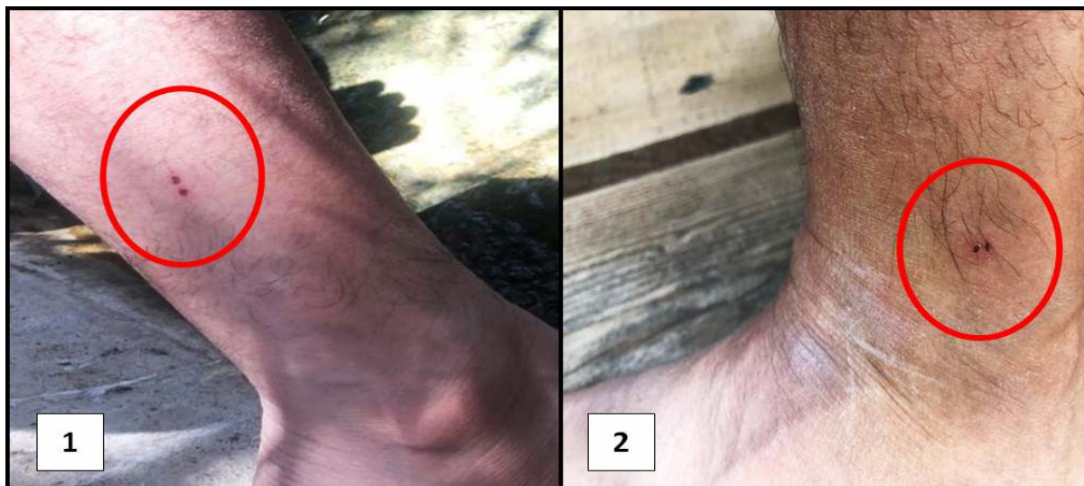
شکل ۲: واکنش‌های پوستی ناشی از گزش عنکبوت شتری؛ (۱) مورد اول (۲) مورد دوم.

استفاده از استریومیکروسکوپ شناسایی شوند. هم‌چنین جهت شناسایی از فرد متخصص در زمینه عنکبوت‌شناسی کمک گرفته شد. پس از شناسایی‌های صورت‌گرفته از نمونه جمع‌آوری‌شده، گونه رتیل ( Galeodes sp. ) تشخیص داده شد (شکل ۳). رتیل در اصل یک شکارچی ساده است و سلاح آن تنها سرعت و قطعات دهانی (انبر قدرتمند) آن است. اگرچه نیش آن‌ها دردناک است ولی برای انسان کشنده نیست. در این مقاله موردی، واکنش‌های