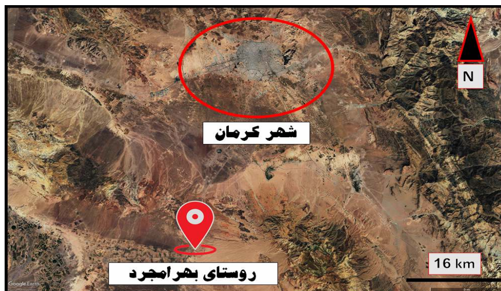
شکل ۱: موقعیت روستای بهرامجرد در اطراف شهر کرمان. تصویر ارائه‌شده از برنامه Google Earth Professional گرفته شده است. ( https://www.google.com/earth/versions/#download-pro ).

مورد ۱: بیمار یک مرد ۳۴ ساله بود که شب هنگام استراحت در روستای بهرامجرد واقع در ۵۰ کیلومتری شهر کرمان در تابستان ۱۴۰۱ دچار گزش (شکل ۱) و چند ساعت بعد از گزش، دچار واکنش پوستی در