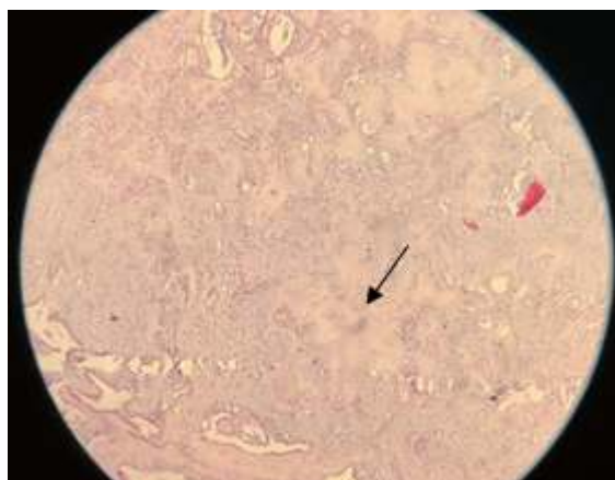
شکل ۳: نمای هیستوپاتولوژیک؛ نشان دهنده استرومای کندرئید.