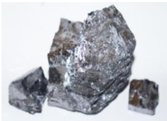
شکل ۲: سنگ سرمه ۱۵ .

روش سنتی با سنگ معدنی مانند گالن، سولفید سرب و آنتیموان به این صورت می‌باشد که ابتدا سنگ سرمه را آسیاب کرده و سپس برای جداسازی ذرات درشت، پودر را الک می‌کنند. در مرحله بعدی به جهت کاهش ناخالصی پودر را با آب شست‌وشو می‌دهند و