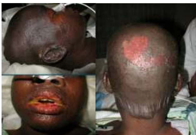
شکل ۱. بثورات پوستی به همراه تاول نرم و زخم سطحی در ناحیه سر و گردن

راش پوستی داشت که تصور می‌شد دلیل این بثورات رادیوتراپی