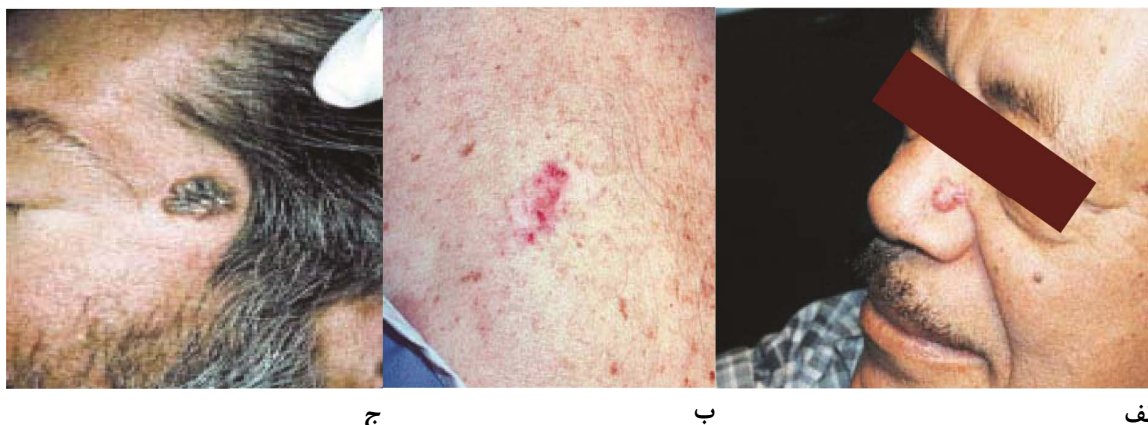
شکل ۱: انواع کارسینوم سلول بازال؛ الف) ندولار ب) سطحی ج) pigmented ۶

ناحیه‌ی بینی است. در ۱۵٪ الی ۴۳٪ موارد ناحیه‌ی گردن درگیر می‌شود. ۲۰٪ موارد بروز کارسینوم سلول بازال در ناحیه‌های پوستی که کمتر در معرض تابش نور خورشید می‌باشند، دیده می‌شود. نئوپلاسم‌های ناحیه‌ی حفاظت‌شده در مقابل نور و یا در نواحی چین‌دار، خطرناک‌تر می‌باشند زیرا دیر تشخیص داده شده و ممکن است باعث پیش‌آگهی بد، مرگ‌ومیر حین عمل جراحی و متاستاز شوند. ۳