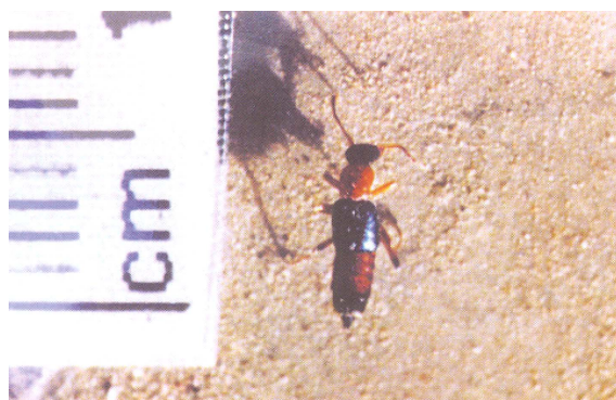
شکل ۱: سوسک پدروس (مأخذ: فصل نامه‌ی بیماری‌های پوست ایران) ۶

طول سوسک پدروس در شکل بالغ آن حدود ۷ تا ۱۰ میلی‌متر و عرض آن ۰/۵ میلی‌متر است. این حشرات در سر و قسمت پایین شکم سیاه‌رنگ و قفسه‌سینه و قسمت فوقانی شکم، قرمز رنگ است ۲۳