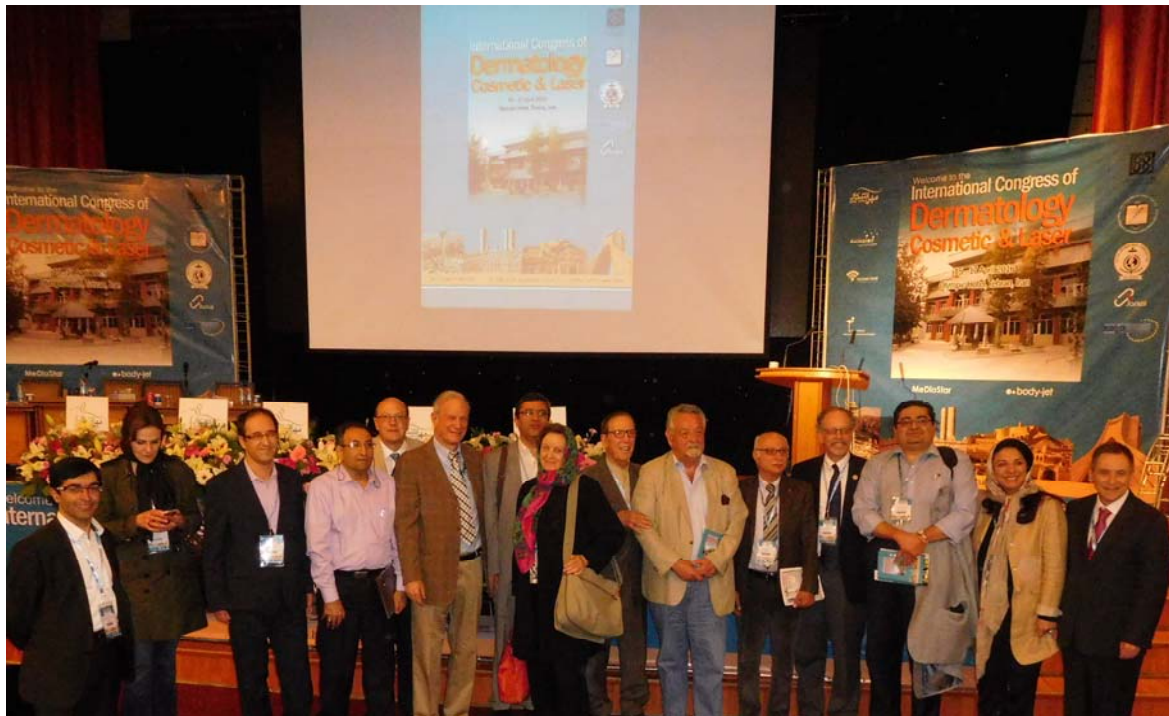
Fig 1. The Congress assembled