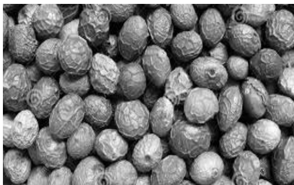
شکل ۲: میوه‌ی خشک بنه

با توجه به خاصیت آنتی‌باکتریال و آنتی‌اکسیدانی این گیاه و فراوان بودن آن در طبیعت و اینکه عوارض جانبی داروهای با منشأ طبیعی به نظر کمتر می‌باشد روی آوردن به سمت گیاهان و تحقیق در این راستا کاری منطقی به نظر می‌رسد. با توجه به اثرات ضدالتهابی عصاره‌ی بنه، شاید بتوان لوسیون یا