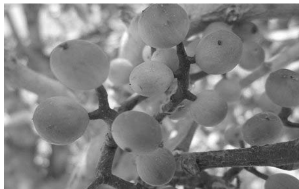
شکل ۱: درخت و میوه‌ی بنه